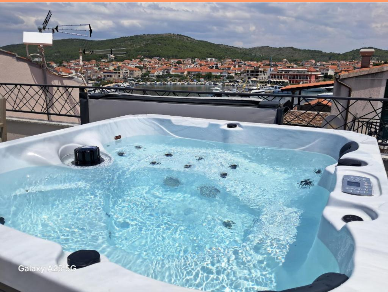
Galaxy A25 5G