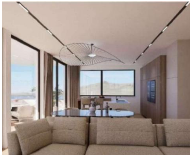
PENTHOUSE 2ND FLOOR LAYOUT BARBIR RESIDENCES SUKOŠAN