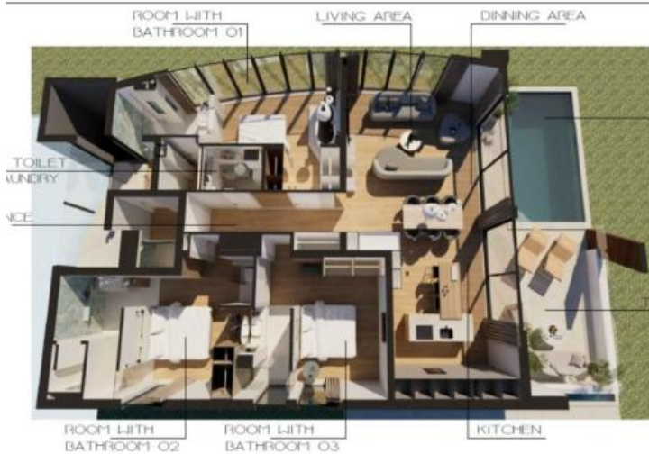
APARTMENT 02 FIRST FLOOR LAYOUT BARBIR RESIDENCES SUKOŠAI