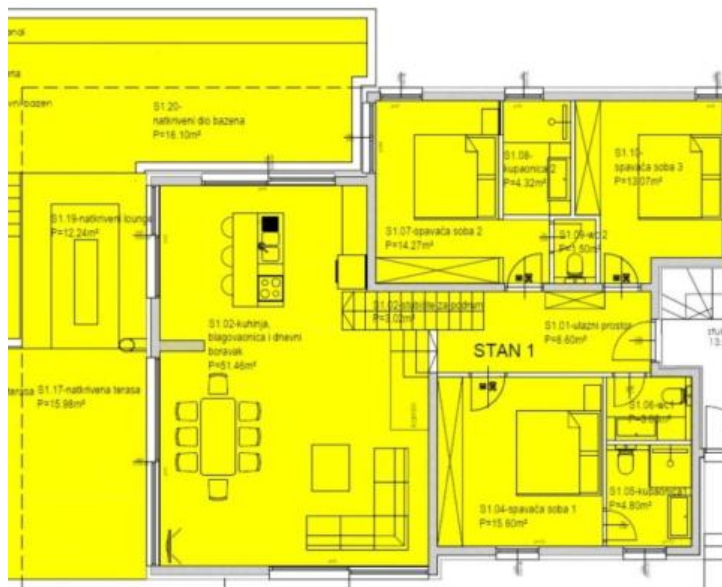
APARTMENT 02 FIRST FLOOR LAYOUT